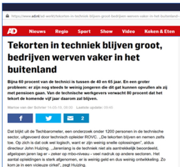
Figuur 1. Artikel uit Algemeen Dagblad, 14 mei 2019

Krapte op de arbeidsmarkt is er echter niet alleen in de metalektro, maar overal, op alle mbo-niveaus (UWV, 2019), en het tekort aan arbeidskrachten in de regio is een van de belangrijkste redenen om internationale werknemers aan te nemen. Al geldt dit niet in alle gevallen: